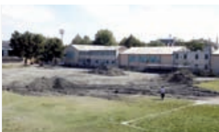
زمین شماره دو قبل از نصب چمن مصنوعی