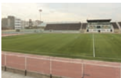
زمین شماره یک بعد از نصب چمن مصنوعی