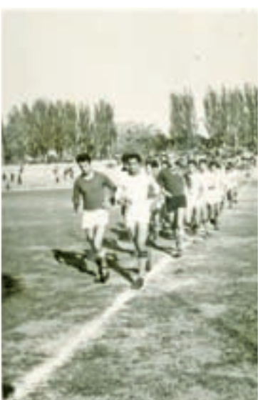
دیدار تیم‌های منتخب مدارس و باشگاه‌های مشهد در زمین شماره یک / ۱۳۴۶