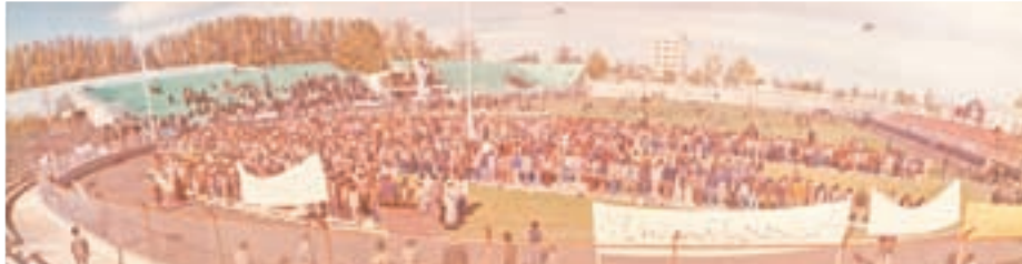
برپایی نماز جماعت ظهر و عصر در روزهای ابتدایی پیروزی انقلاب اسلامی / زمین شماره یک در زمین شماره یک / ۱۳۴۶