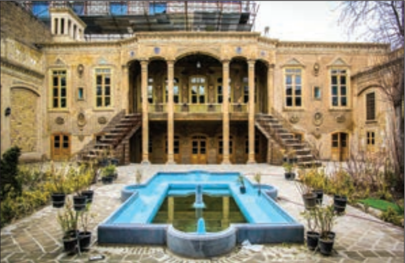
عکس: خانه پدری/محمد حسن طرطور لاهیجان

عابد - «سلام. خانه پدری من در منطقه ثامن است و از نظر قدمت، تاریخی به شمار می‌رود. نمی‌خواهم این خانه پر از خاطره را به دست بسازو بفروش‌ها بسپاریم و به دنبال بهسازی این بنای موروثی هستیم اما نمی‌دانیم از چه راهی پیگیری کنیم. لطفا در این زمینه اطلاع‌رسانی کنید.»