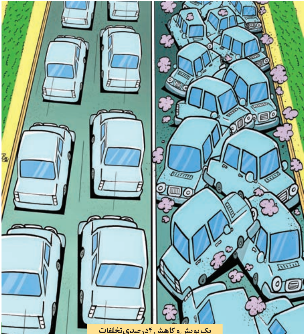
یک پویش و کاهش ۴ درصدی تخلفات