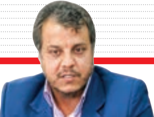
مدیر محیط‌زیست شهری شهرداری مشهد خبر داد