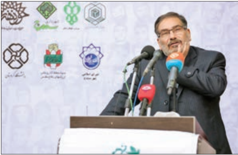
سرخانی در جریان سخنرانی

دریابان علی شمخانی نماینده مقام معظم رهبری و دبیر شورای عالی امنیت ملی روز گذشته به استان کردستان سفر کرد و در چند برنامه این استان به سخنرانی پرداخت. به گزارش تسنیم، دریابان علی شمخانی دبیر شورای عالی امنیت ملی در گفت‌وگو با خبرنگاران رسانه‌های گروهی در سنندج گفت: کوله‌بری پاسخ شایسته‌ای به وفاداری و وفاداری جامعه کردی نبوده و باید تلاش کنیم با فراهم کردن زمینه‌های اشتغال پایدار در کردستان این وضعیت خاتمه یابد. وی افزود: کوله‌بری در هیچ کجاشایسته نیست و نباید فراموش کنیم که انقلاب اسلامی و مسئولان کشور هیچ‌گاه به دنبال به وجود آمدن این مسئله نبودند. دبیر شورای عالی امنیت ملی با اشاره به خطرات فراموش نشدنی خود از حضور و هم‌رزمی با پیش‌مرگان کرد در سال‌های قبل و حین دفاع مقدس افزود: مردم سلحشور کردستان در سال‌های غربت انقلاب با تمام وجود در برابر توطئه ضد انقلاب و متجاوزان خارجی ایستادگی کردند و کردستان قهرمان در مسیر دفاع از ارزش‌های ملی و دینی بیشترین شهید اهل سنت را تقدیم انقلاب اسلامی کرد.