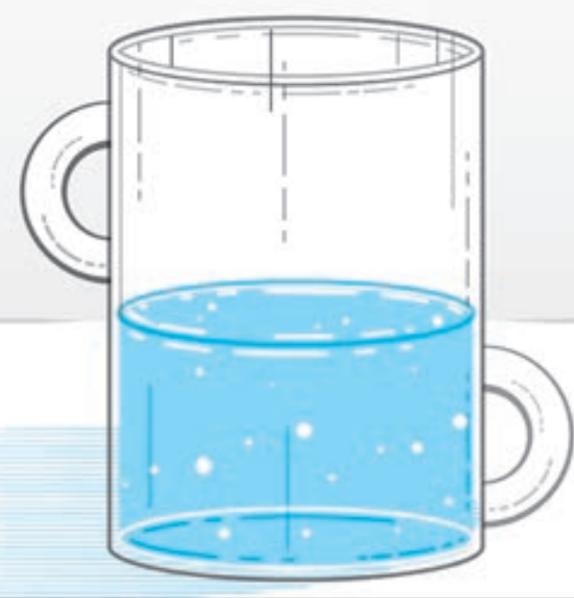
طرح: حامد پیرایش/ نیاز شوهر