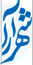
روزنامه شهراهامید ویژه‌نگاری

ظرفیت‌های این شهر هستند. لذا مدیریت شهری حمایت از آن‌ها را امری ضروری و لازم می‌داند. رئیس شورای شهر مشهد با تأکید دوباره بر رویکرد حمایتی شورای شهر از رسانه‌ها در سال ۹۸ گفت: سیاست حمایتی شورای شهر صرفاً منوط به بخش مطبوعاتی نشده است و بخش‌های دیگر همچون سمن‌ها، مجموعه‌های غیردولتی، انجمن‌های فرهنگی و هنری و سازمان‌های مردم‌نهاد نیز مشمول این حمایت خواهند شد. ●