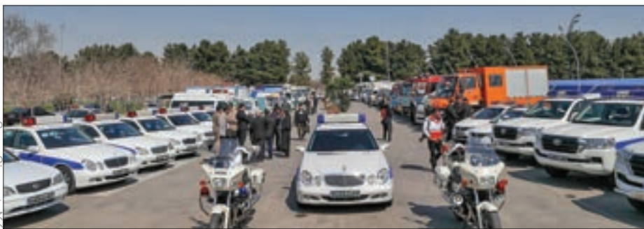
تکمیل محاسبات و پرداختن به امور

مانور خدمت دستگاه‌های اجرایی استان برای پذیرایی هرچه بهتر از زائران و مسافران نوروزی برگزار شد