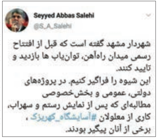
تزیینت تابلو رنگ و آوازشناسان در زمینه اعلام شهردار مشهد.

خودرو و افراد معلول رعایت نشده است. در کنار یکی دو مورد پله، سطح شیب‌دار وجود ندارد. جویچه‌های عرضی خیابان پارکینگ خودرو به مناسب‌سازی نیاز دارد. دیوار سنگی