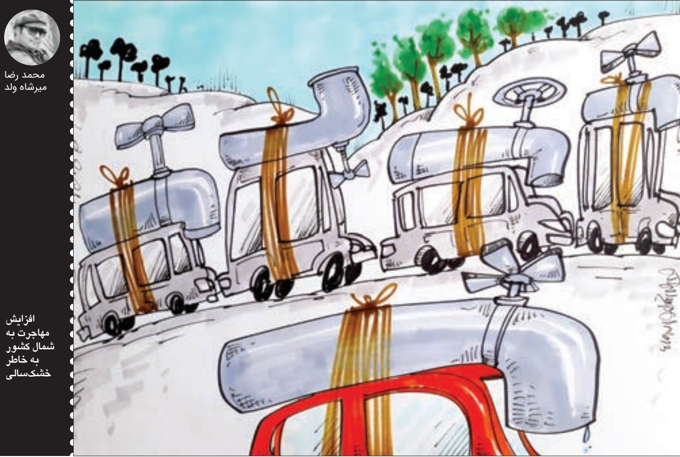
محمد رضا میرشاه ولد