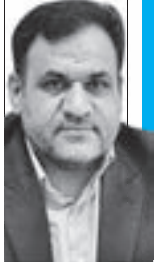
مدیرعامل شرکت قطار شهری مشهد با بیان اینکه

اینکه عملیات انسداد ۲ هزار حلقه چاه فاقد مجوز در استان برای امسال در نظر گرفته شده است افزود: در همین راستا تاکنون ۷ هزار و ۵۰۰ حلقه چاه فاقد مجوز استان شناسایی شده است. ●