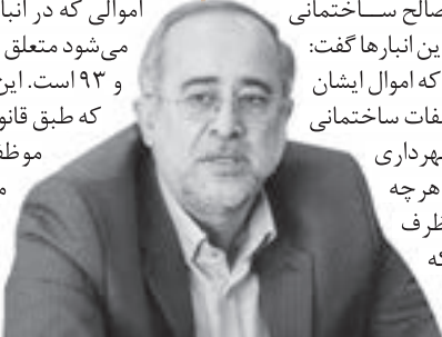
شهردار مشهد در جلسه کمیسیون حقوقی اتاق بازرگانی، صنایع و معادن خراسان

شده است، برای پس گرفتن آن‌ها اقدام کنند. وی ادامه داد: برخی از اموالی که در انبارها نگهداری می‌شود متعلق به سال‌های ۹۲ و ۹۳ است. این در حالی است که طبق قانون، شهرداری موظف است تنها ۹ ماه از این اقلام نگهداری، سپس با هماهنگی