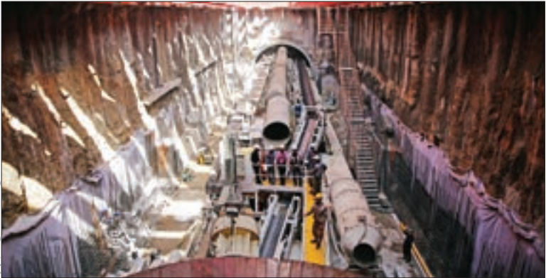
عملیات حفر ایستگاه شیراز