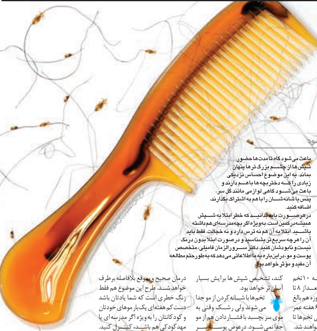
شیوع شپش در مدارس مختلف

مناسب‌ترین برخورد با وجود آنچه گفته شد، نباید خیلی نگران باشی؛ چرا که این مشکل با