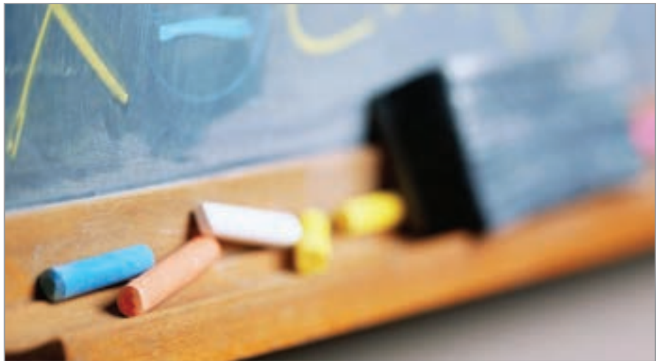
مصداق جزای ابروعطا

گوشواره های دانش آموزان دختر یکی از مدارس مشهد در سرویس بهداشتی به سرقت رفت