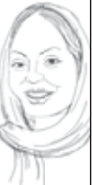
طراحی: مهدی محمدی

۳۵۵...۹۱۵...اخبار شبکه ۵ روز پنجشنبه، فیلمی را نشان می‌داده که در آن، مأموران شهرداری سیگی را در شهر باغستان روی زمین می‌کشند و خون از سر و روی این حیوان می‌ریختند. واقعا برای این مأموران متاسفم. چرا زود قضاوت می‌کنید؟ واقعتاً آن است که سگ یکپهو وسط خیابان پریده و با خودروی تصادف کرده و بعد این مأمور قصد کمک به او داشته که چون سگ از آمبولی زدن می‌ترسیده، برای رفتن به بیمارستان مقاومت می‌کرده است! اما این مأمور دلسوز برای آنکه جان سگ را نجات دهد او را به زور روی زمین می‌کشید تا سگ را به بیمارستان برساند و جانش را نجات دهد. آیا نباید از این مأمور تشکر و قدر دانی شود؟